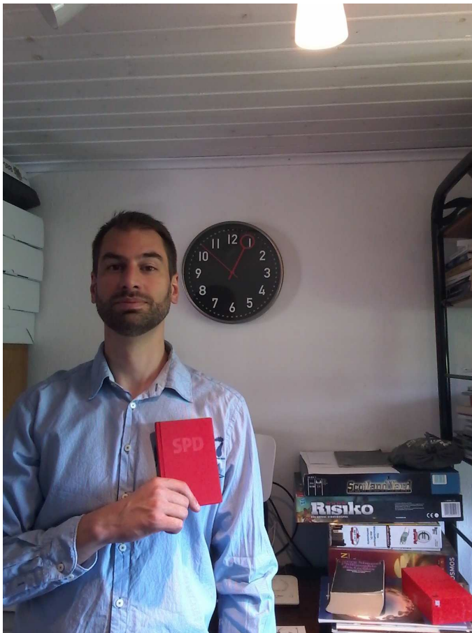
Abbildung 1: Foto von mir, damit sie glauben, dass ich in der SPD bin.

mar.nietan@bundestag.de, Udo.Bullmann@spd.de, Brandenburg@spd.de