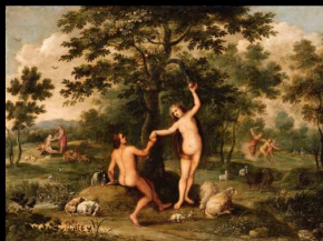
Abbildung 1: Der Sündenfall: Die Entdeckung des Zinses durch den Menschen vor 6.000-13.000 Jahren. Zitat aus einem Artikel der FAZ: „Es gibt zwischen den ältesten Sprachen der Menschheit eine interessante Parallele. Die Sumerer, die etwa 3000 Jahre vor Christi Geburt Mesopotamien (also in etwa die Gegend des heutigen Iraks) bevölkerten, kannten bereits ein Wort für Zins: Es hieß in ihrer Sprache mash, und es bedeutete gleichzeitig „Kalb“. Die Griechen sprachen von tokos, was zugleich „junges Rind“ hieß. Und die Ägypter sagten ms, was auch „Leben geben“ bedeutete.“. Der ganze Artikel ist hier .

negative Zinsen auf Guthaben und Kredite, also das logische Gegenteil des kapitalistischen Prinzips , Wirtschaft zu finanzieren.