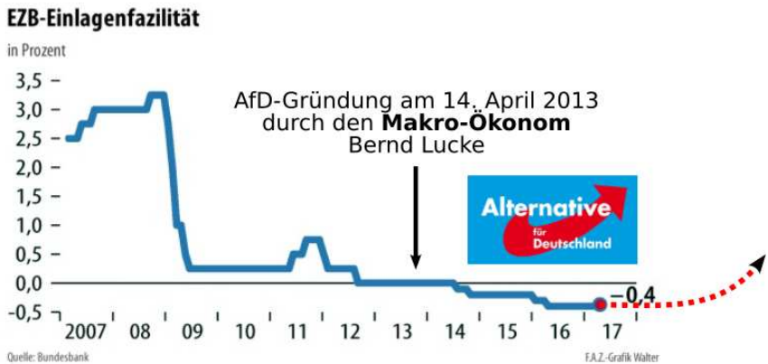
Abbildung 1: Die AfD will geschlossen, dass die Zinsen wieder steigen.

Parteilogo der AfD wie ganze Partei steht für wieder steigende Zinsen! Man sehe sich doch einmal das Gejammer an.