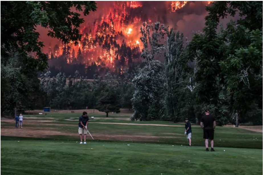
Abbildung 1: Spiel am Abgrund.

Ein bisschen grün sind wir alle, denn uns dämmert nach diesem Sommer, dass der Klimawandel sich wahrscheinlich noch zu unseren Lebzeiten auf eine drastische Weise konkretisieren wird: uns droht eine Heißzeit!