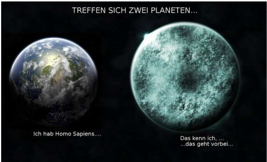
Abbildung 3: Der Planet ist krank, aber das geht von alleine vorüber.