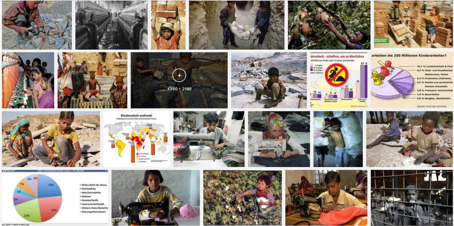
Abbildung 2: 1. u. 2. v. oben: Phasen der Bevölkerungs-Entwicklung (Quelle : www.oekosystem-erde.de ). 3. v. oben Das Phänomen der Kinder-Arbeit. Die wohl schlimmste Form der Heteronomie ist der Kindes-Missbrauch. Unten: Ein Teil der Geschichte der Menschheit und die letzten 500 Jahre: das Anthropozän .

http://www.oekosystem-erde.de/html/bilder/bevoelkerung-industrie.gif